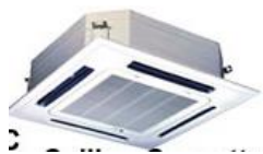
Gambar 5.4 Jenis AC Ceiling Cassette

Pada area resepsionis digunakan AC Cassette 2 PK, sedangkan pada area tunggu digunakan AC wall mount. Di dalam ruangan seperti ruangan pemeriksaan dan rawat inap, perlu adanya AC. Pemasangan AC ini dimaksudkan untuk menjaga suhu ruangan serta memberi kenyamanan bagi pengguna. Selain itu AC dapat menjaga suhu tetap 20°C untuk perlakuan khusus untuk alat medis.