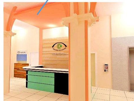
Gambar 5.1 View area respsionis