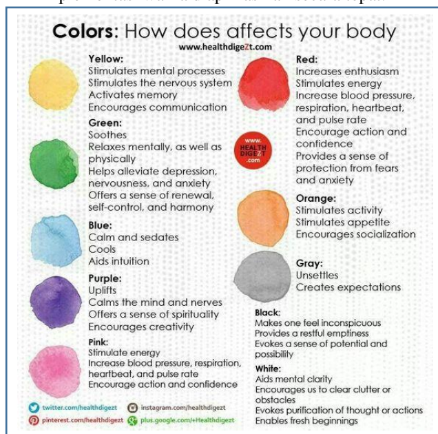
Gambar 2.1 Pengaruh warna terhadap tubuh

berupa lingkungan binaan. Dalam sebuah healing design , warna merupakan salah satu komponen yang sangat penting. Sebuah lingkungan binaan akan mempunyai nilai penyembuhan lebih jika implementasi warna diaplikasikan secara tepat.