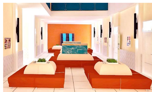
Gambar 5.2 View Area Tunggu

Dinding terbuat dari bata yang diplester, lalu difinishing dengan cat tembok, di beberapa ruangan dinding dipadukan dengan pengaplikasian wallpaper sebagai aksen ruangan. Konsep dinding tidak banyak diubah, hanya menambahkan walpaper atau variasi tekstur (misal panel dinding kayu) untuk finishing sebagai aksen ruangan.