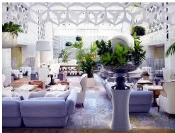
Gambar 2.3 Contoh Vegetasi pada Interior