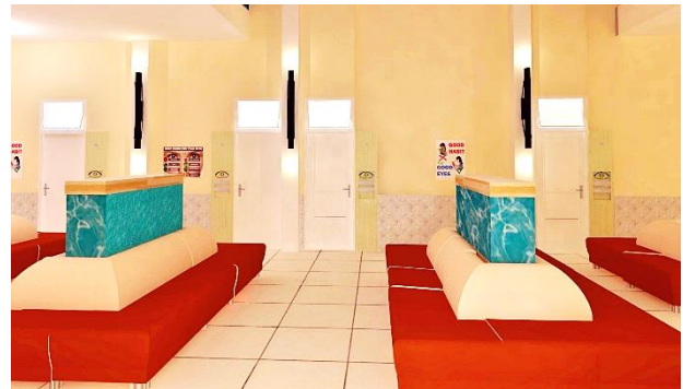
Gambar 5.5 View Area Tunggu

yang mungkin ditimbulkan oleh pencahayaan merata. Sistem ini dapat digunakan pada area yang bersifat penerimaan atau juga aksent elemen interior. Dapat digunakan untuk signage atau aksent ruangan Malang Eye Center.