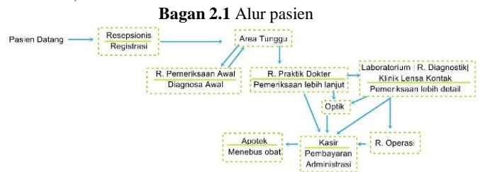
(sumber: dokumen pribadi, 2016)

Observasi bertujuan untuk dapat merasakan dan menangkap secara langsung suasana yang dirasakan pasien dari kondisi, dan fasilitas yang ada pada Malang Eye Center. Alur pasien pada Malang Eye Center, sebagai berikut;