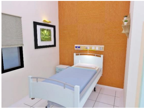
Gambar 5.3 View Area Tunggu dan Rawat Inap